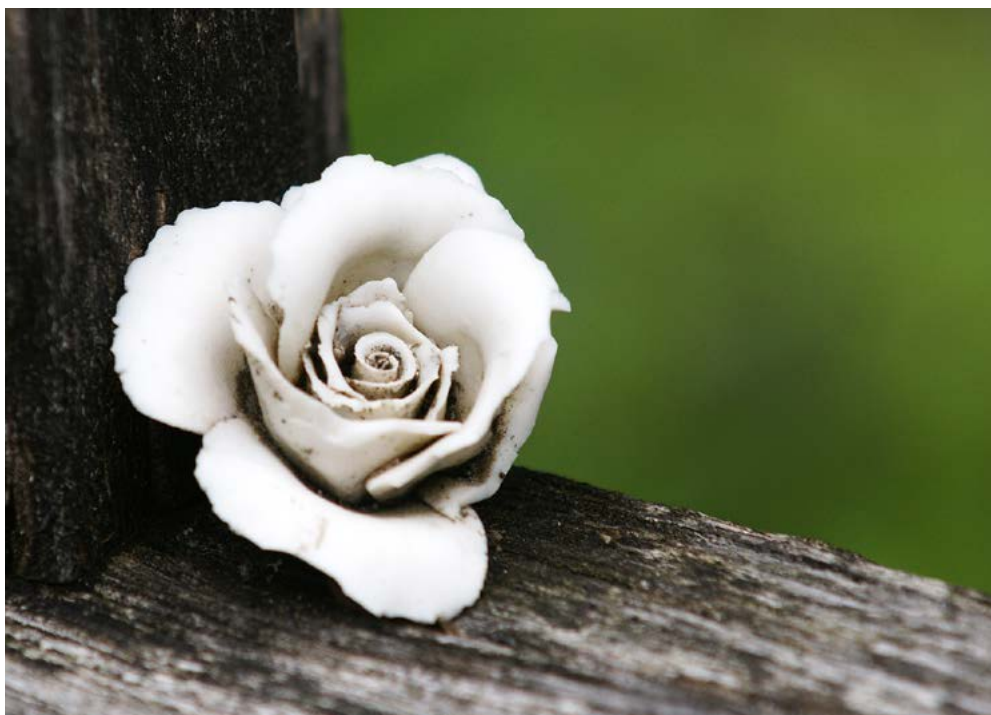
Rituale – auch kirchliche – helfen, die Trauer zu bewältigen, Foto: Pixabay.

Darum ist es nicht gut, wenn auf einem Zettel steht: Ich will keine Abdankung für mich. Denn – bitte verzeih' mir diese klaren Worte – eine Abdankung ist in erster Linie für die Hinterbliebenen da, nicht für dich! Darum: Sprich mit deinen Angehörigen. Sag ihnen, um was du dich sorgst: Aufwand, Finanzen, komische Trauergäste... was auch immer? Aber überlasse IHNEN die Entscheidung, wie sie sich von dir verabschieden möchten. Denn SIE müssen damit weiterleben, nicht DU!