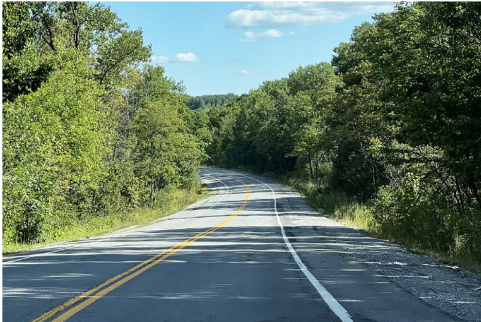
Ohne zu wissen, wohin mich die Strasse führen würde, habe ich mich Mitte August auf das grösste Abenteuer meines Lebens begeben.