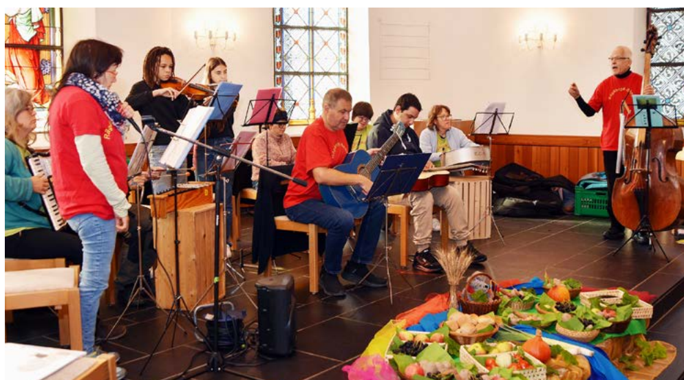
Erntedank-Gottesdienst in Niederurnen mit der Rägäbogä-Bänd, Foto: Jürg Huber.

Die Musik war aber bei beiden Anlässen nicht das einzige, das sie vom traditionellen Gottesdienst unterschied. So gab es in Mollis einen religiösen Smartphone-Input, bevor Referent Marco Bächtiger mit Unterstützung von Filmausschnitten darüber sprach, wie man sein eigenes Potential entdecken kann. Hier sah man, was ein von Geburt an arm- und beinloser Mann trotz Beein-