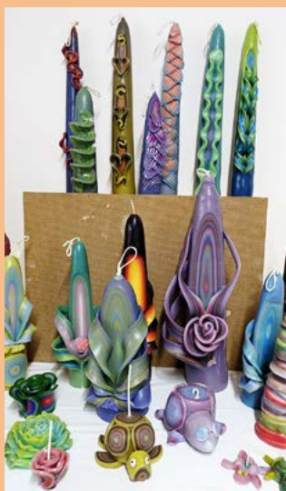
Die Kerzenwerkstatt im Kirchgemeindehaus ist wieder offen, Foto: zvg.

Donnerstag, 6. November, Gottesdienst in der Stadtkirche, 8.30 Uhr, Predigt: Pfrn. Manja Pietzcker. Um 10 Uhr Eröffnung der Verhandlungen im Landratssaal.